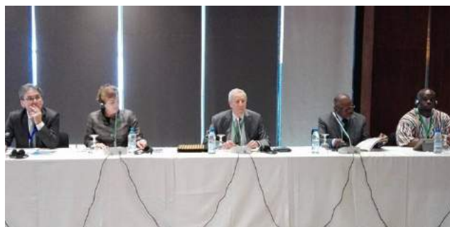
Le Secrétaire général (2 e à partir de la droite) à la table ronde sur la thématique de la qualité, entouré des ministres marocain et libérien avec la participation de la DG du GPE (2 e à partir de la gauche)

La Triennale 2017 a porté sur le thème : «Revitaliser l'Éducation dans la perspective du Programme Universel 2030 et de l'Agenda 2063 pour l'Afrique». Quatre sous-thèmes ont été développés : la mise en œuvre de l'éducation et de l'apprentissage tout au long de la vie pour le développement durable; la promotion de la science, des mathématiques et des TIC; la mise en œuvre de l'éducation pour la renaissance culturelle africaine et les idéaux panafricains; et la promotion de la paix et de la citoyenneté mondiale à travers l'éducation.