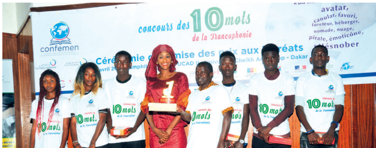
La représentante de la Fondation Sonatel remettant le 1 er prix de la mise en scène (niveau national - Sénégal)

Dans le cadre de la Quinzaine de la Francophonie, la CONFEMEN a organisé avec l'appui de ses partenaires, la 12 e édition du concours des 10 mots de la Francophonie qui a porté cette année sur le thème « Dis-moi dix mots sur la toile ». Les 10 mots de l'édition 2017 sont : avatar, canular, favori, fureteur, héberger, nomade, nuage, pirate, émoticône et télésnober .