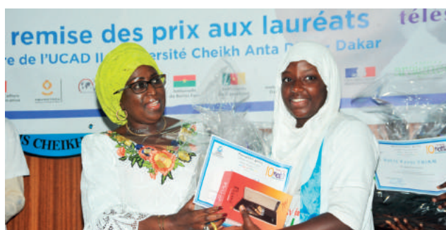
La représentante personnelle du Chef de l'Etat sénégalais auprès de la Francophonie a donné un prix spécial à la lauréate du 1 er prix national en production écrite, niveau 4 e -3 e

Dans le cadre de la Quinzaine de la Francophonie, la CONFEMEN a organisé avec l'appui de ses partenaires, la 12 e édition du concours des 10 mots de la Francophonie qui a porté cette année sur le thème « Dis-moi dix mots sur la toile ». Les 10 mots de l'édition 2017 sont : avatar, canular, favori, fureteur, héberger, nomade, nuage, pirate, émoticône et télésnober .