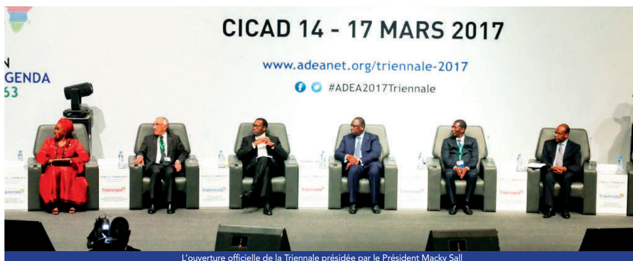
L'ouverture officielle de la Triennale présidée par le Président Macky Sall

La Triennale 2017 de l'Association pour le développement de l'éducation en Afrique (ADEA) s'est tenue à Dakar, au Sénégal, du 14 au 17 mars 2017, sous le haut patronage de SE Monsieur Macky Sall, Président du Sénégal et Président du Comité des dix chefs d'État africains champions sur l'Éducation, les Sciences et la Technologie.