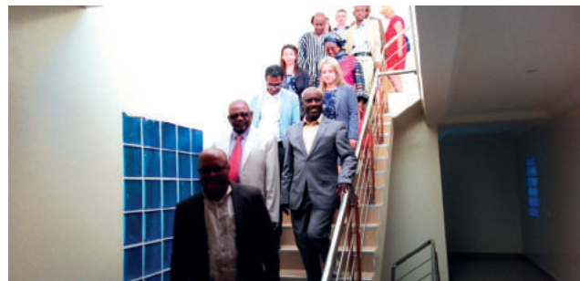
A l'occasion de la réunion du groupe de travail des CN, les participants ont visité les locaux devant abriter prochainement les bureaux de l'IFEF

Le Directeur de l'IFEF et le Secrétaire général de la CONFEMEN ont tous les deux reconnu et salué le partenariat naturel entre l'OIF et la CONFEMEN qui sont appelées à travailler ensemble pour réaliser les objectifs communs de développement de l'éducation et de la formation dans l'espace francophone. Les deux Institutions se sont engagées à renforcer la collaboration dans le contexte de mise en œuvre du Cadre d'action Education 2030.