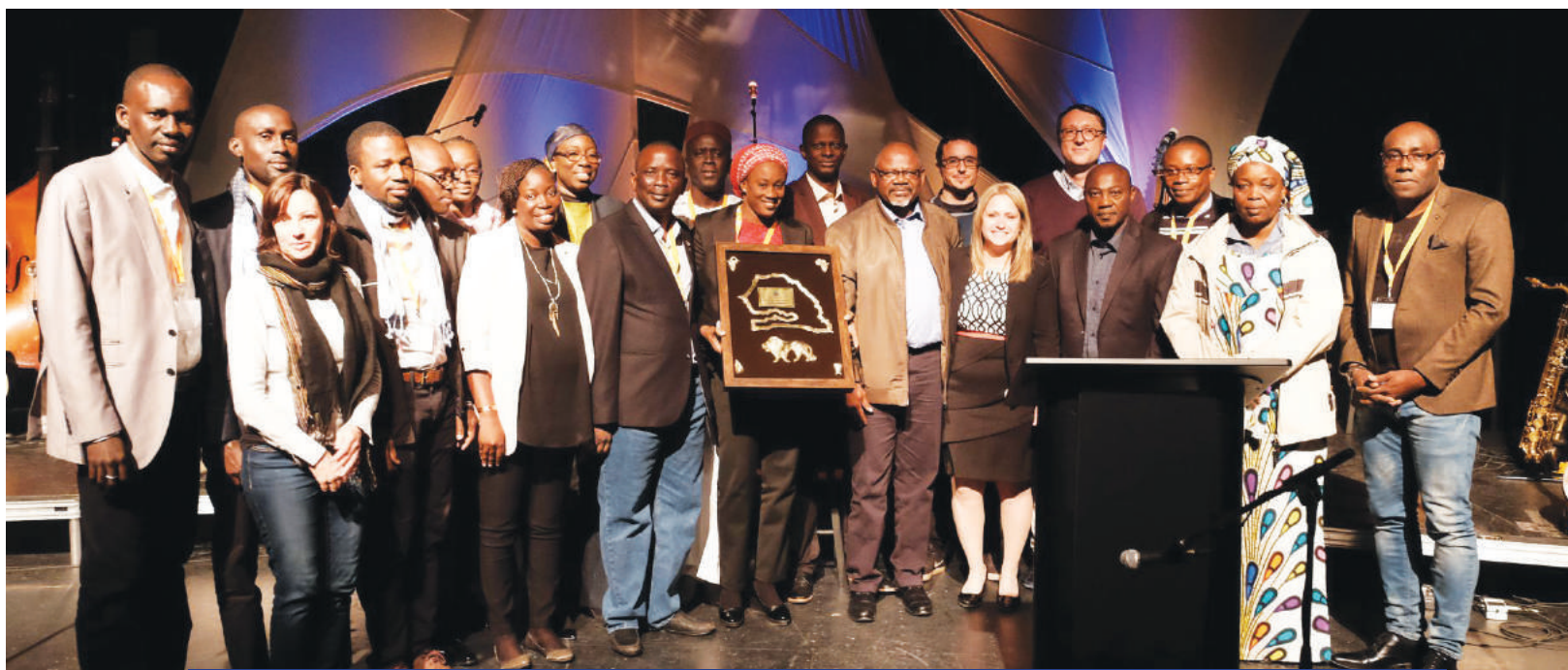
L'équipe du STP remettant un cadeau au SG de la CONFEMEN

La soirée a été l'occasion de remercier tous les organisateurs et organisatrices pour le travail de logistique remarquable et l'accueil chaleureux tout au long de cette 58 e Session ministérielle.