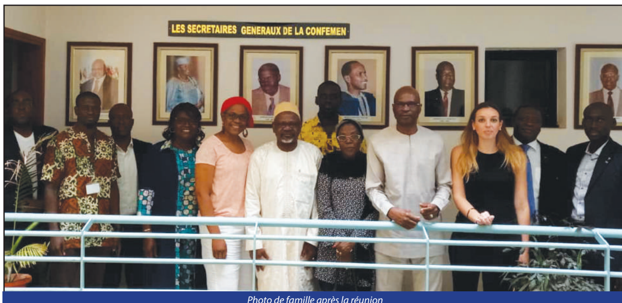
Photo de famille après la réunion

Il s'est tenu le 28 juin 2018 dans les locaux de la CONFEMEN, une réunion de plusieurs acteurs impliqués dans le projet régional de promotion des valeurs du sport. Cette réunion a connu la présence de représentants des institutions que sont la CEDEAO, le CNOSS, la CONFEMEN, la CONFES, le Ministère de l'enseignement supérieur de la Côte d'Ivoire, l'OMS, ONUFEMMES, l'UNESCO et l'UNDOC.