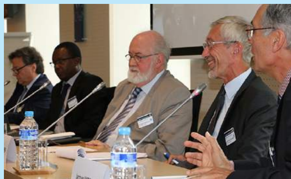
Le représentant de la CONFEMEN 2 e à partir de la gauche