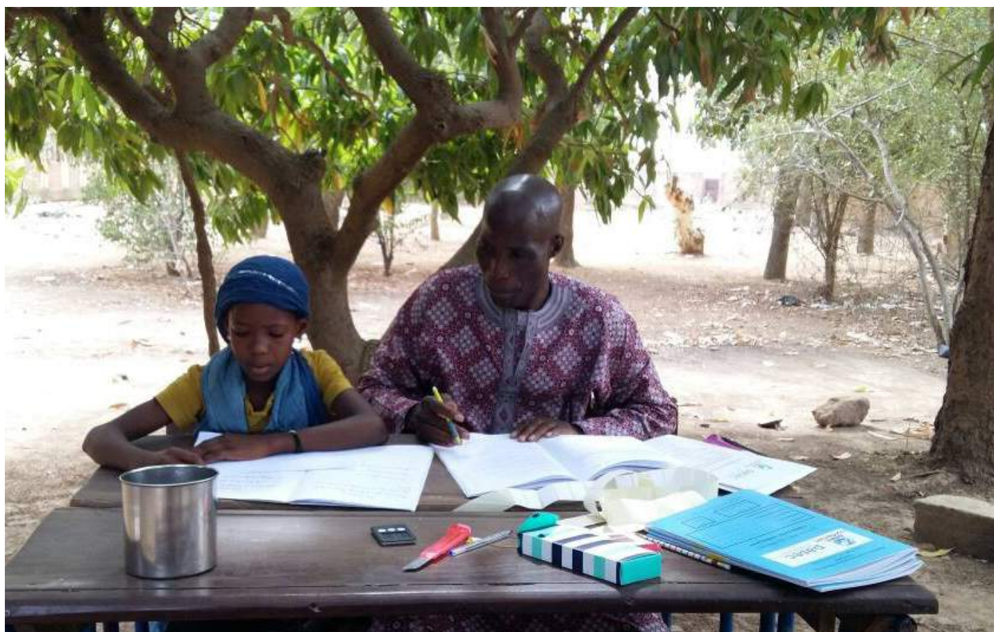
Un élève en séance de test avec un administrateur dans une école du Mali

Dans le cadre de la mise à l'essai des instruments et procédures de l'évaluation PASEC2019 qui concerne 15 pays, l'équipe des conseillers techniques du PASEC a été mobilisée pour des missions de supervision-appui à la formation aux administrateurs des tests. Ces activités ont concerné 14 pays que sont, le Bénin, le Burkina, le Burundi, le Cameroun, la Côte d'Ivoire, le Gabon, la Guinée, le Mali, le Niger, la R. D. Congo, Madagascar, le Sénégal, le Tchad et le Togo. Les missions se sont déroulées entre le 2 avril et le 20 juillet 2018.