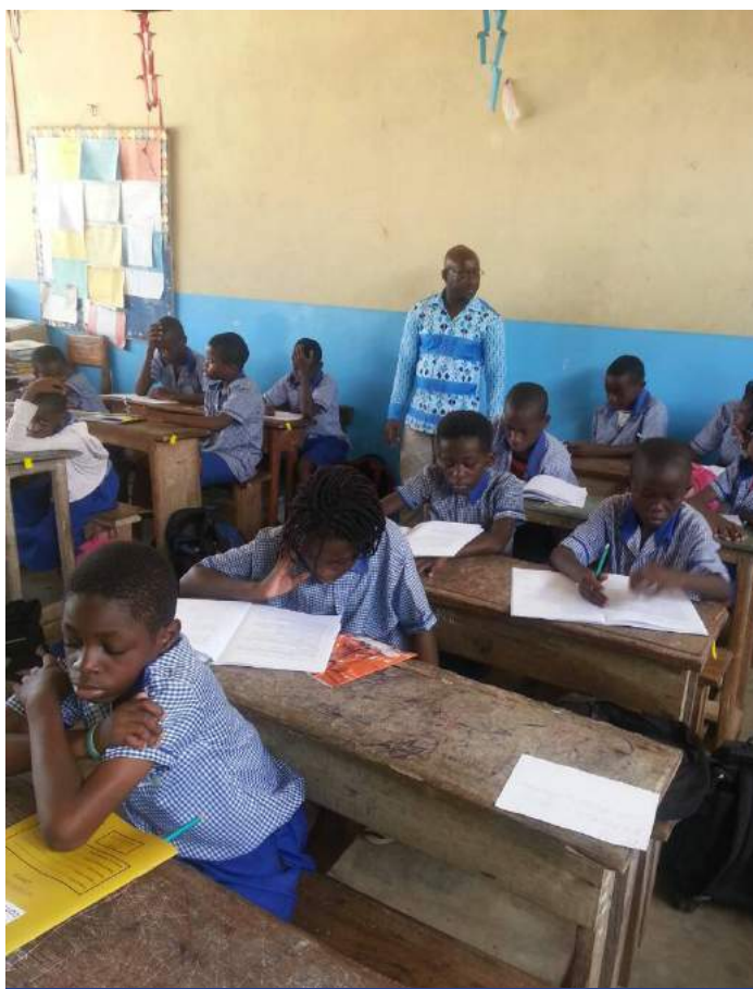
Séance de test sous la supervision de l'administrateur à Libreville (Gabon)